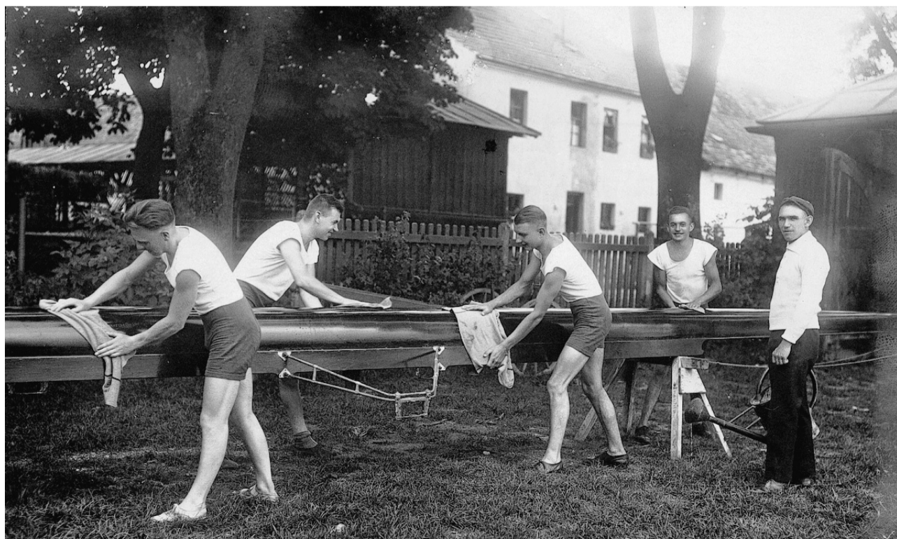
Bei der Pflege eines Viererboots 1927.

In nationalsozialistischer Zeit fand „auch beim Ruderclub ... eine Gleichschaltung und Anpassung“ statt. Der Vereinsvorsitzende nannte sich nun „Vereinsführer“, die neue Satzung bestimmte entsprechend den Vorschriften des Deutschen Reichsbundes für Leibesübungen als Vereinszweck „die leibliche und seelische Erziehung seiner Mitglieder im Geiste des nationalsozialistischen Volksstaates durch die planmäßige Pflege der Leibesübungen, insbesondere des Rudersports“. Aktiv waren fast nur noch die Damenmannschaften und die neu gegründete Jugendabteilung, die sich zum Beispiel im September 1937 an der Reichs-Jugend-Regatta in Berlin-Grünau beteiligte.